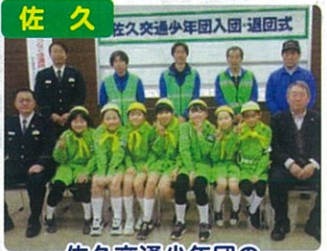
佐久交通少年団の 入団・退団式