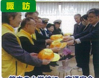
管内の小学校に、交通安全 啓発品(黄色い帽子)を贈呈