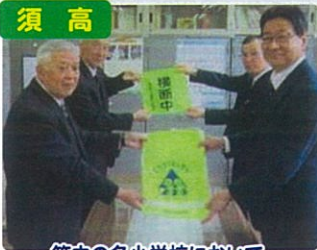
管内の各小学校において、 新入学児童ハンドセルカバーを贈呈