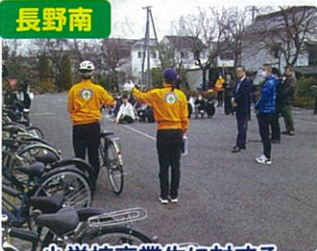
小学校卒業生に対する 自転車安全教室の実施