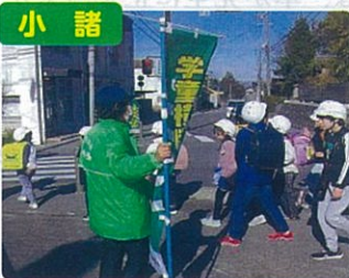
横断歩道マナーアップ作戦