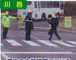
管内の中学校前における 横断指導の実施