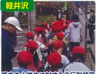
管内の小学生に対する歩行訓練等 交通事故防止啓発指導を実施