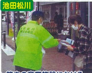
管内の商業施設における、 交通安全広報啓発活動