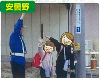
通学路における見守り活動