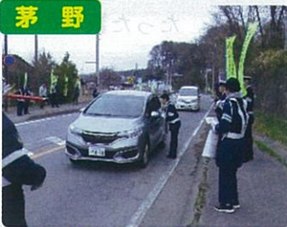
国道20号線での啓発活動