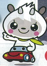
長野県交通安全協会マスコット 「あんきょーくん」