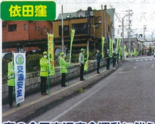
春の全国交通安全運動に伴う 交通指導所の実施