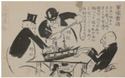
望月桂「軍縮会議」の風刺画